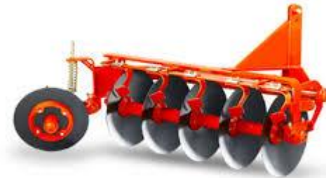
ภาพใบผาลพรวนที่ใช้กับโครงผาลพรวน

ใบผาลพรวนเป็นโลหะมีลักษณะคล้ายจานกระทะกลม ติดกับอุปกรณ์ต่อพ่วงที่เรียกว่า พรวนจาน (Disc harrow) ซึ่งจัดเป็นเครื่องมือเตรียมดินขั้นที่สอง (Secondary tillage) ใช้สำหรับพลิกกลับหน้าดินที่ผ่านการไถบุกเบิกแล้ว โดยจะทำให้ดินที่เป็นก้อนใหญ่แตกออกเป็นก้อนเล็กและพลิกหน้าดินลงไปด้านล่างเพื่อนำเอาแร่ธาตุบนผิวดินลงไปใต้ผิวดิน พรวนจานสามารถนำไปใช้กับดินไถแทบทุกชนิด หรือสามารถใช้กับดินไถหลากหลายชนิด ในบางกรณีพรวนจานแบบใช้งานหนัก (Heavy duty harrows) สามารถนำไปใช้ในขั้นตอนการเตรียมดินขั้นแรกได้ถ้าดินมีคุณสมบัติที่เหมาะสม เนื่องจากพรวนจานทำให้ดินผืนใหญ่แตกกรวนเป็นก้อนเล็กได้