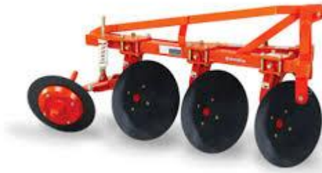
ภาพใบผาลมกเบ็กที่ใช้กับโครงผาลมกเบ็ก