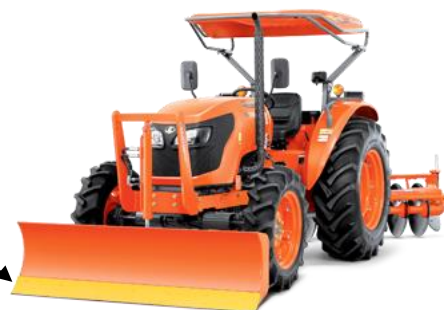
ภาพรถแทรกเตอร์

ใบดันดินของบริษัทผลิตขึ้นจากเหล็กกล้าคาร์บอนสูงเป็นชิ้นเดียวไร้รอยต่อ ทำให้มีความแข็งแรงและทนทานต่อการสึกหรอสูง ใช้เป็นอะไหล่ของอุปกรณ์ไถเกลี่ยด้านหน้ารถแทรกเตอร์ เพื่อปรับหน้าดินให้เรียบ