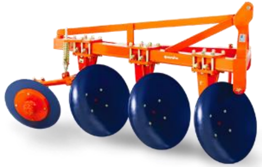
ภาพโครงผลาลบุกเบิก

โครงผลาลต้องออกแบบให้มีขนาดเหมาะสมและความแข็งแรงสูง โดยทั่วไปจะออกแบบให้มีลักษณะเป็นโครงเหล็กกลมหรือโครงเหล็กเหลี่ยมซึ่งยึดกับชุดของใบผลาล โครงผลาลบางชนิดออกแบบให้สามารถลดหน้ากว้างในการไถหรือสามารถปรับลดจำนวนใบผลาลได้ เพื่อให้รองรับกับขนาดของรถแทรกเตอร์ หรือสภาพของพื้นที่ที่จะทำการไถ การปรับหน้ากว้างในการไถแต่ละใบผลาลให้ลดลง ทั้งนี้โครงผลาลบุกเบิกของบริษัทใช้หลักวิศวกรรมในการออกแบบ ผลิตโดยใช้เหล็กโครงสร้างคุณภาพดีทำให้มีความแข็งแรงทนทาน